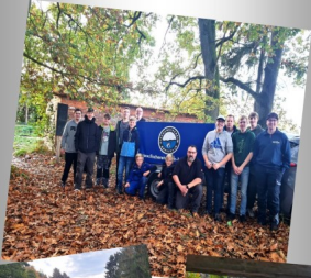
Tagesausflug der Jugendgruppe am 28.10.2022